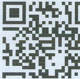
รูปเล่ม รายงานผลการดำเนินงานประจำปีงบประมาณ พ.ศ.๒๕๖๘ ( ครั้งที่ ๒ ระหว่างเดือน เมษายน พ.ศ.๒๕๖๘ - กันยายน พ.ศ.๒๕๖๘ )

(๓) รายงานผลและเสนอความเห็นซึ่งได้จากการติดตามและประเมินผลแผนพัฒนาต่อผู้บริหารท้องถิ่นเพื่อให้ผู้บริหารท้องถิ่นเสนอต่อสภาท้องถิ่น และคณะกรรมการพัฒนาท้องถิ่น พร้อมทั้งประกาศผลการติดตามและประเมินผลแผนพัฒนาให้ประชาชนในท้องถิ่นทราบในที่เปิดเผยภายในสิบห้าวันนับแต่วันรายงานผลและเสนอความเห็นดังกล่าวและต้องปิดประกาศไว้เป็นระยะเวลาไม่น้อยกว่าสามสิบวันโดยอย่างน้อยปีละหนึ่งครั้งภายในเดือนธันวาคมของทุกปีสำหรับรายละเอียดของการติดตามและประเมินผลแผนพัฒนาท้องถิ่นของ อบต.โคกตาล ประจำปีงบประมาณ พ.ศ.๒๕๖๘ นั้น มีรายละเอียดดังนี้